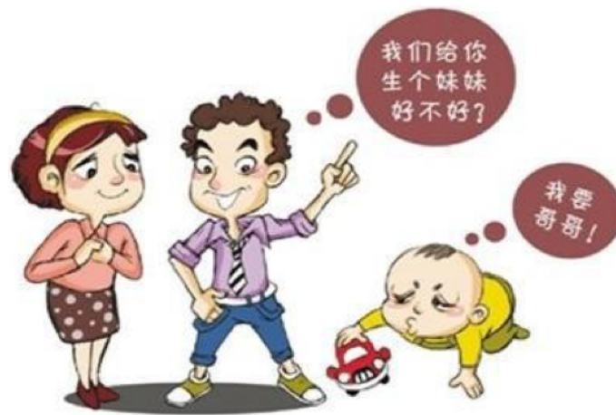
(亲贝网 qinbei.com 配图)